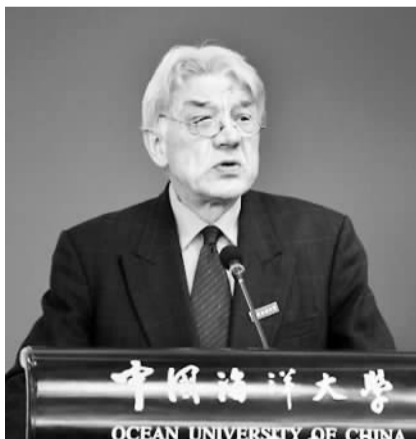
顾彬正在中国海洋大学做讲座

11月12日下午1时30分，一位身穿笔挺西装的外国人步入中国海洋大学学术报告厅。此时，容纳200人的报告厅里响起一片掌声。