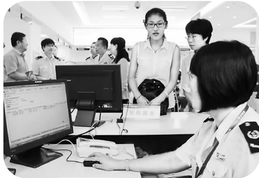
企业代表正在办理跨境电商出口退税。

如今，跨境电商出口退税功能，不仅将极大提升青岛跨境B2C的海外竞争力，促进青岛传统外贸转型，也将进一步凭借前瞻的政策流程，打造吸引国内跨境电商集聚的“软环境”。