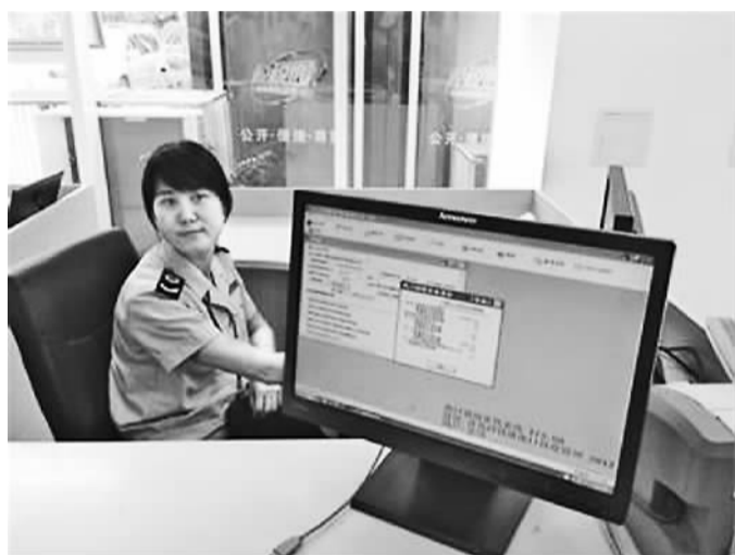
当日，山东省首笔跨境电商出口退税正式交出。