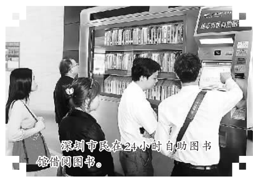
深圳市民在24小时自助图书馆借阅图书。