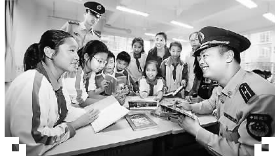
世界读书日深圳武警官兵与小学生分享读书心得。

人类有史以来第一个提到文化权利的正式文件是1948年12月。联合国大会通过的《世界人权宣言》指出，人人有权通过国家的努力和国际合作，实现自己的文化权利。而深圳首次提出市民文化权利，始于首届读书月。