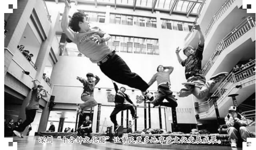
深圳“十分钟文化圈”让市民更多地享受文化发展成果。

文化部文化科技司司长于平说，“实现市民文化权利”这个观念涉及尊严。人活着要有尊严，并不是解决温饱就满足了。每个人都有文化需求，实现市民文化权利包含着一种意向，即给人一种更高的尊严，需要政府通过履行文化责任来满足公众文化需求，满足市民享有、参与和创造文化的权利。深圳还倡导“阅读赢得尊重”，是通过保障市民阅读权利，让市民提升素质，去追求和获得尊严，