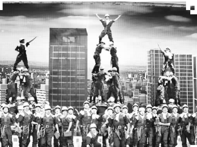
由深圳劳工组成的民工街舞团走上央视春晚舞台。

回首往昔，它代表着深圳十几年来文化探索，体现了城市的一种文化自觉；展望未来，它将继续影响着城市的文化走向，彰显城市的文化自信文化自强。