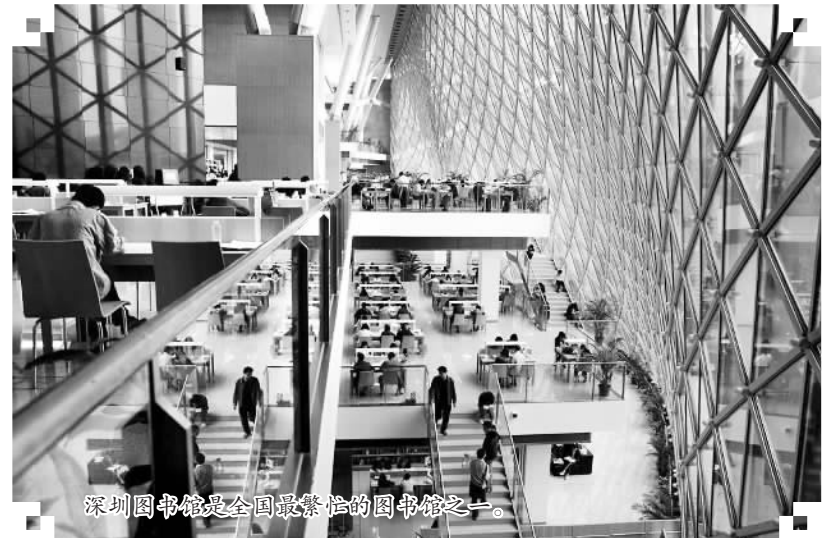
深圳图书馆是全国最繁忙的图书馆之一。