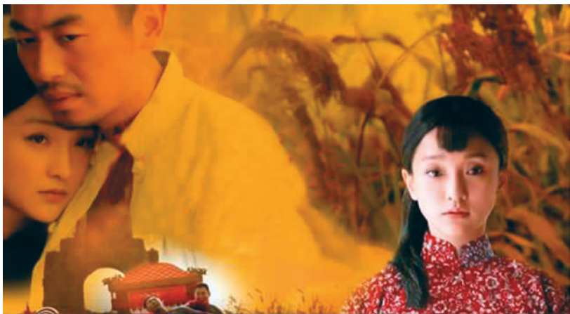
情理之中：“50后”“60后”意料之外：“90后”“00后”

凭借文学及电影的影响力、高水平的制作团队以及演员精湛的表现，电视剧《红高粱》开播伊始就赢得超高人气和口碑，不仅四大播出平台（山东卫视、北京卫视、浙江卫视、东方卫视）收视齐齐破1，最高收视率破2，更以网络播放量3周突破25亿的成绩，创下国内电视剧多个收视记录，成为2014年当仁不让的“压轴大戏”。