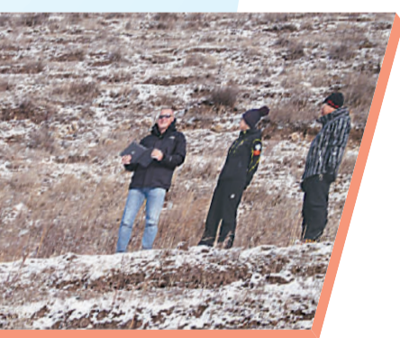
图片说明:专家组考察情景。