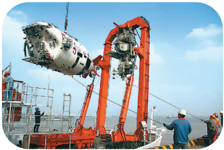
11月23日,在江苏省江阴市苏南国际码头,“蛟龙号”载人深潜器被顺利安装在试验母船“向阳红09”船上,将于25日远赴西南印度洋执行试验性应用航次第二、三航段任务。图为“蛟龙”号被缓缓吊起。