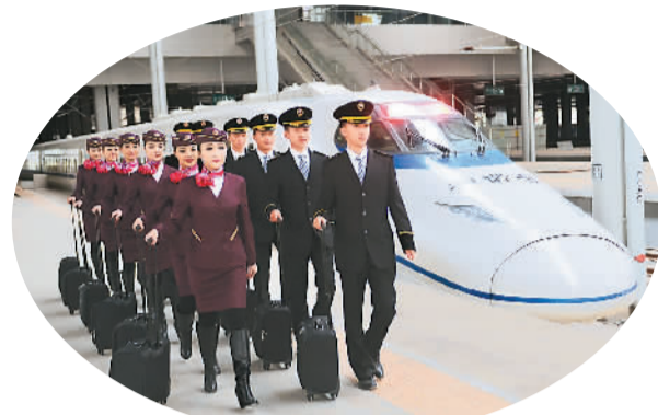
11月23日,兰州铁路局兰州客运段高铁车队乘务员首次身着制服亮相。