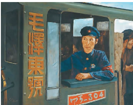
特等劳动英雄李永像 吴作人