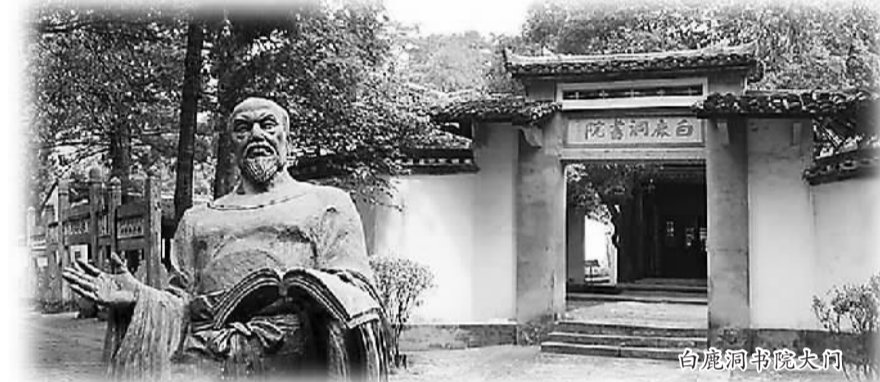
白鹿洞书院朱子像

朱熹不仅复兴白鹿洞书院的教学，而且，还有效地把推广理学和书院教育结合起来。其亲自制定的学规，即今天我们看到的《白鹿洞书院教条》，是中国