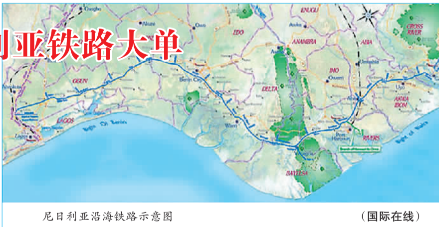
尼日利亚沿海铁路示意图

本报北京11月20日电 (记者严冰) 北京时间今天凌晨, 尼日利亚交通部部长依瑞士·乌斯曼与中国铁建中非建设有限公司副董事长曹保刚, 在尼首都阿布贾正式签署尼日利亚沿海铁路项目的合同, 合同总金额达119.7亿美元, 全线将采用中国铁路技术标准。这是中国对外工程承包史上单体合同金额最大的