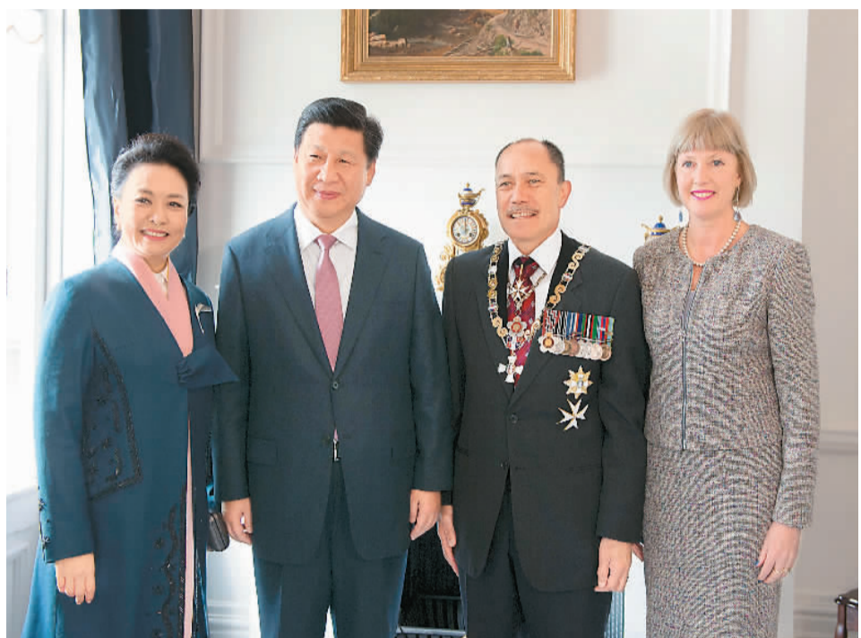
左图: 习近平主席和夫人彭丽媛同新西兰总理约翰·基、副总理霍华德、工党领袖阿德恩、新西兰总督杰弗里·莱舍在惠灵顿举行会谈。