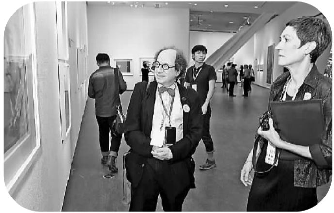
图为外国艺术家在中国版画博物馆参观。

本报电 近日，国内最大的版画专业博物馆——中国版画博物馆正式开馆并举办“2014首届中国版画大展”。中国版画博物馆是观澜版画原创产业基地整体规划建设的重要组成部分，是全国首个专业版画博物馆，也是全球规模最大、设施最齐全、功能最完善、学术最权威、运作最规范的专业版画艺术博物馆。该馆将打造成为具有作品展示、学术研究、文化艺术教育等功能的国际化平台。该项目于2012年12月正式开工建设，总概算1.179亿元，占地面积1.76万平方米，总建筑面积1.86万平方米，由中国美术家协会分党组书记、常务副主席吴长江先生担任首任馆长。博物馆的建成弥补了国际上中国版画专业展馆的缺失，为中外版画交流提供了一个新的合作平台，实现了中外版画学术交流信息共享。