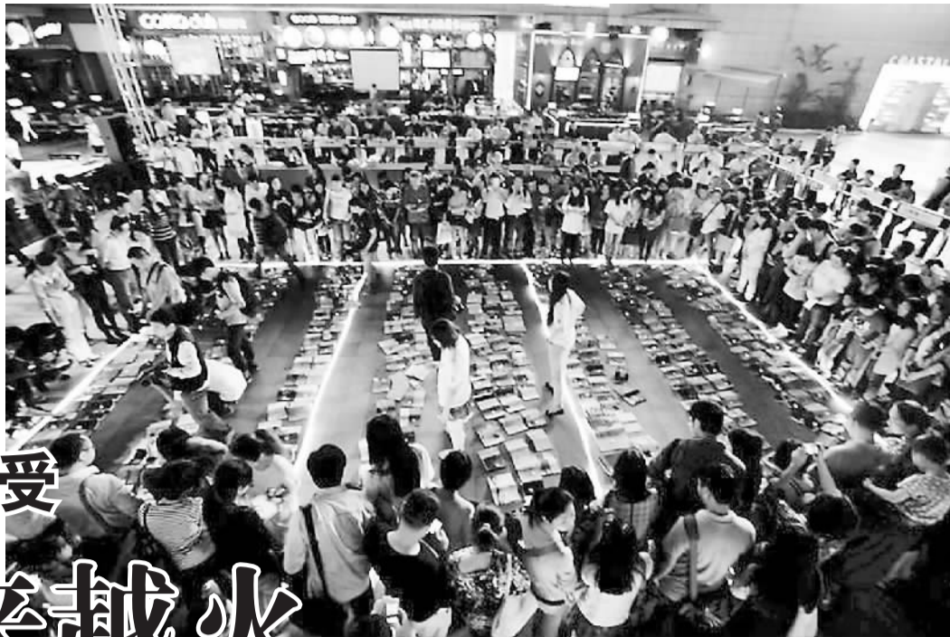
“城市萤火虫”换书大会吸引大量深圳市民参加。

今年，深圳读书月已经连续举办了15年。15年来，深圳读书月举行了约4000项阅读活动，参与人数从首届的170多万人次上升到第14届的千万人次。今年的第15届将再次刷新阅读活动和参与人数的记录，火热程度一年胜过一个。广东省委常委、深圳市委书记王荣在参加阅读分享活动中说，读书使得这个新兴的城市更加成熟，也提升了城市的品位。“市民在读书的氛围里更加幸福，参与到读书月活动中的人越来越多，深圳的人均购书量在全国名列前茅，说明深圳读书月起到的作用已经不仅仅是推动阅读，更是让很多市民自觉地爱上阅读。” 15年的“高贵坚持”不但让这座年轻的城市成为“全球全民阅读典范城市”，赢得了国际荣誉，获得了世界尊重，而且让阅读成为城市的新民俗，提升了市民文化归属感和城市认同感。有人形容，深圳读书月由一株稚嫩的幼苗长成了一棵枝繁叶茂的大树。这棵大树成长的营养何在？就在于持续创新和全民参与。