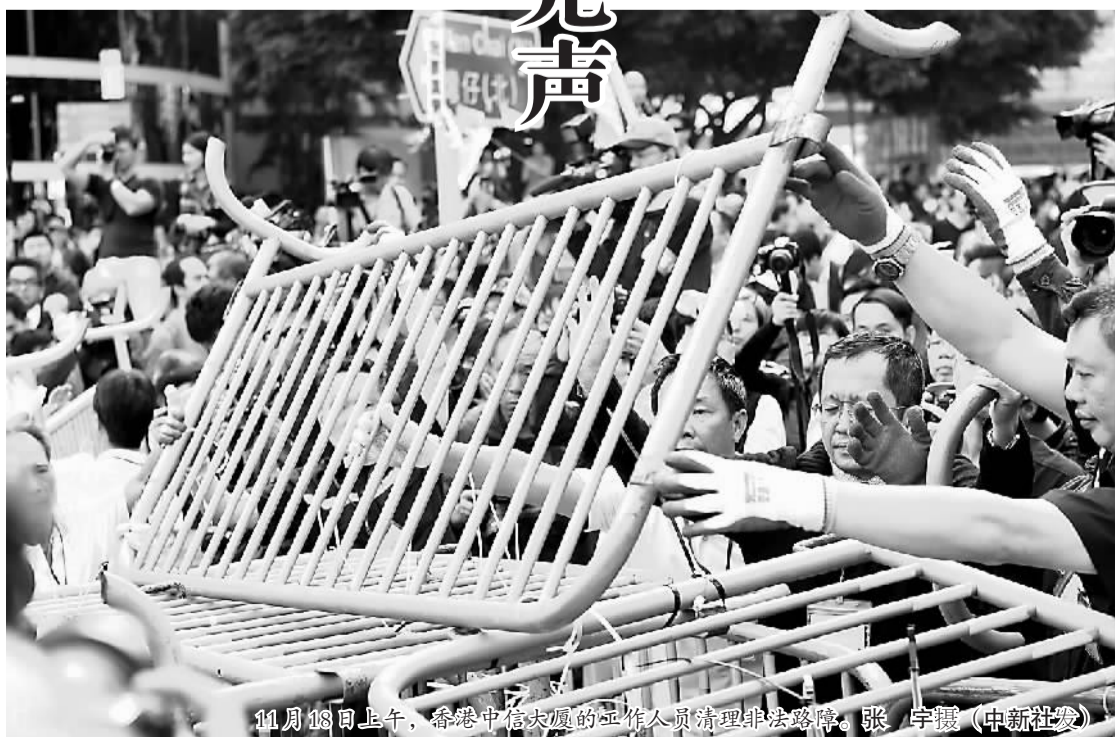
11月18日上午，香港中信大厦的工作人员清理非法路障。

自称“爱香港”的反对派们应该算算这么一笔账——香港地区去年的GDP仅为内地的3%左右，因此万一香港爆发动荡，会对本地中短期经济造成不小损害，但对整个中国的经济却无关痛痒。有人引用一句俗语“敬酒不吃吃罚酒”，劝告示威人士及泛民阵营，如果想以强硬方式行事或者继续纠缠不休，最终或会自食其果。