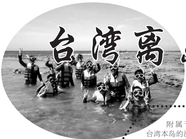
绿岛每年都吸引大量游客前来浮潜。