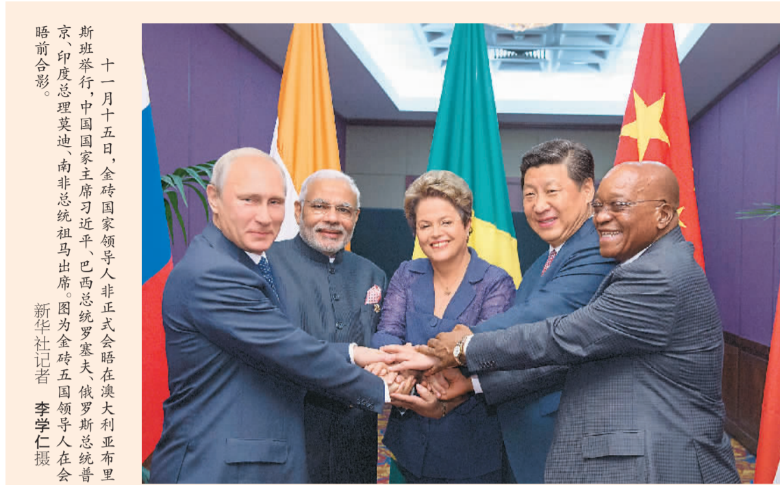
十一月十五日,金砖国家领导人非正式会晤在澳大利亚布里斯班举行,中国国家主席习近平、巴西总统罗塞夫、俄罗斯总统普京、印度总理莫迪、南非总统祖马出席。图为金砖五国领导人在会晤前合影。

习近平强调,中国经济增长是世界经济增长的重要动力。根据国际组织测算,中国是二十国集团全面增长战略的最大贡献者之一。这样的贡献,源自中国自身稳增长、调