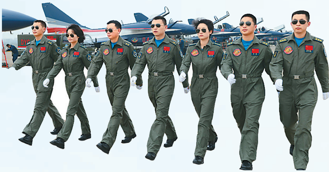
中国空军“八一”飞行表演队

按照计划，长征运载火箭今年将迎来第200次发射。从1970年中国发射第一颗人造卫星东方红一号开始，中国运载火箭经过了其堪称辉煌的发展历程，走过几个阶段：从最初的串联式捆绑式，从常温推进剂到低温推进剂，从液体推进剂到固体推进剂，从一次启动能力到二次启动能力等发展和跨越，中国运载火箭已经把我国带入了世界航天大国的行列。中国运载火箭的近200次发射中，技术研究院承担了