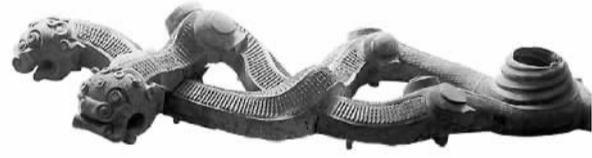
秦代青铜龙（现藏于陕西历史博物馆）

陕西历史博物馆的镇馆之宝之一的青铜龙，被发现时已经被文物贩子肢解，差点儿就流散海外。