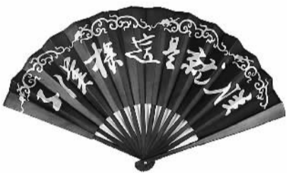
“朕就是这样汉子”折扇