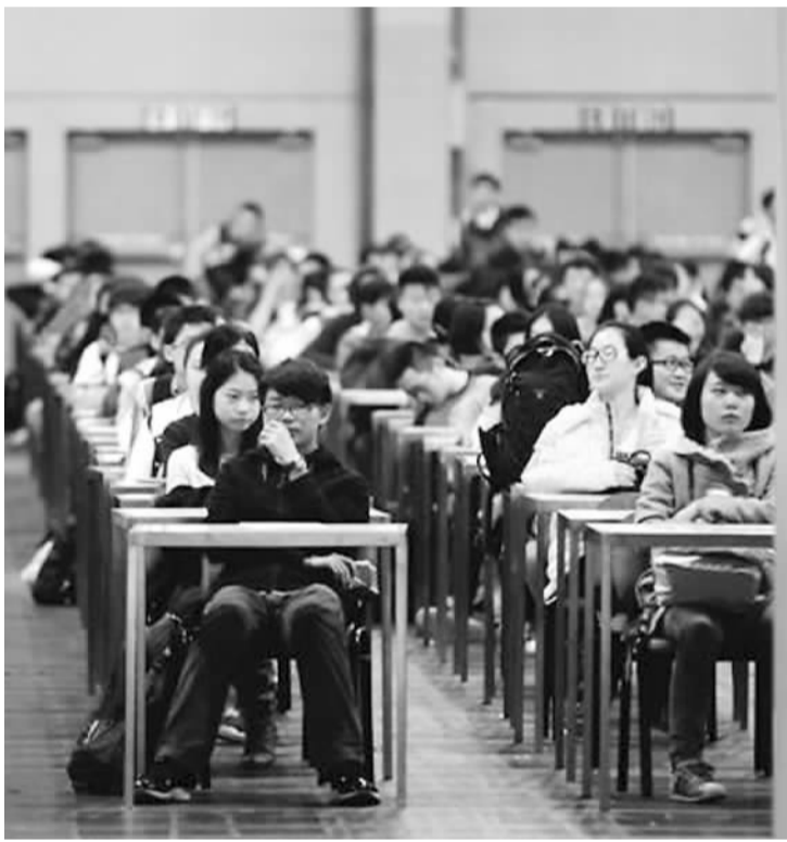
二〇一四年一月九日香港考场