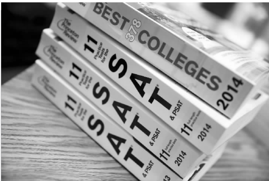
在美国迈阿密拍摄的SAT考试复习书

据美国《纽约时报》网站报道，美国大学入学考试（SAT）的管理者日前表示，将暂缓公布于10月上旬参加考试的中国和韩国学生的成绩。报道称，负责在全世界管理这项考试的美国教育考试服务中心（ETS）表示，将延期公布10月11日的应试者成绩，至少临时推迟，因为“基于确切、可靠的信息”，可能存在作弊行为。