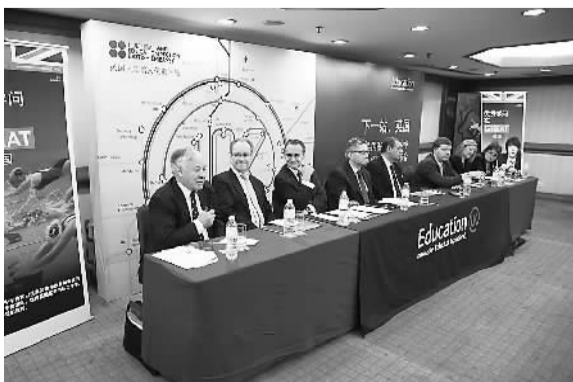
“下一站，英国寄宿中学”活动现场，几位寄宿中学校长在回答问题。

据悉，英国寄宿中学（Boarding School）泛指提供寄宿服务的私立学校。这些学校大多历史悠久，许多寄宿学校有超过600年的历史，而英国现存最古老的寄宿学校则建于公元597年。