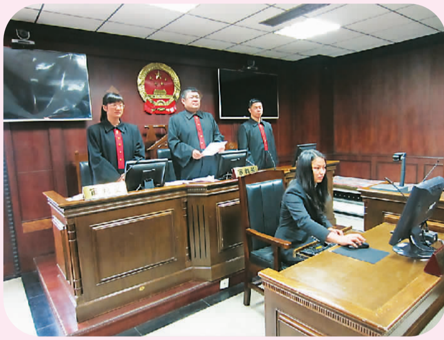
图为成都市中级人民法院正在宣判一起涉外知识产权案件