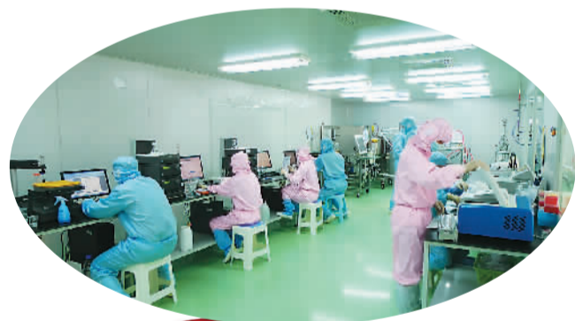
烟台荣昌制药股份有限公司生物实验室