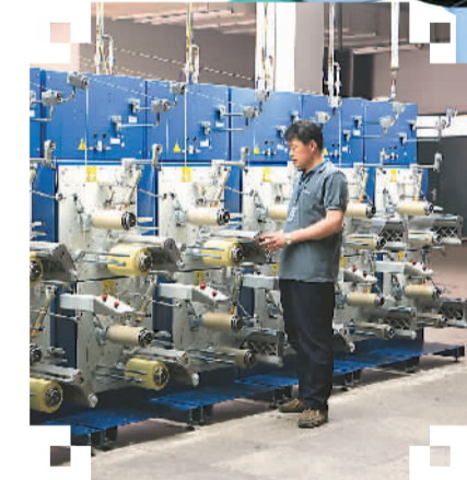
烟台泰和新材芳纶生产线一角