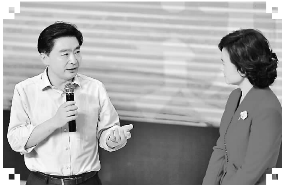
图为深圳市委书记王荣分享自己的读书经历。

书月组委会举办的“数字图书与未来科技”国际研讨会，将就“新技术、新媒体对阅读的影响”、“阅读对城市发展的影响和作用”、“互联网技术对传播价值的提升”等议题向全球发布深圳会议宣言。