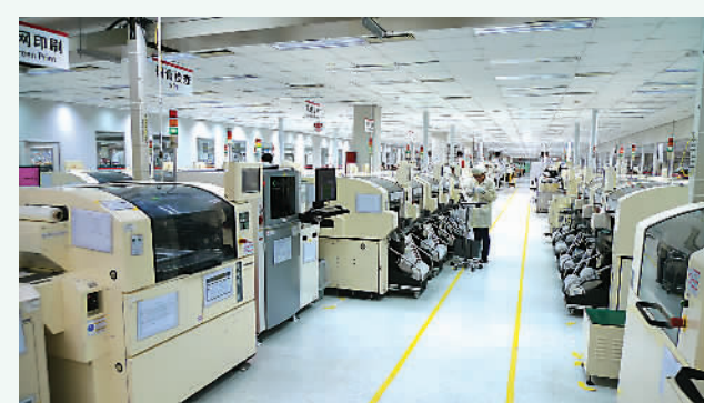
浪潮乐金数字移动通信有限公司手机生产线