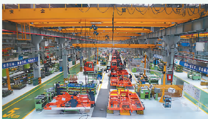
斗山工程机械（中国）有限公司生产车间