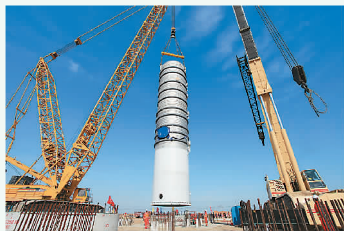
建设中的万华烟台工业园

在六大转调新政的推进下，近两年，全区新材料、生物医药、新光电三大新兴产业的投资年均增长135%，服务业增加值占比每年提高1.4个百分点以上。烟台开发区正迎来产业转型的春天。