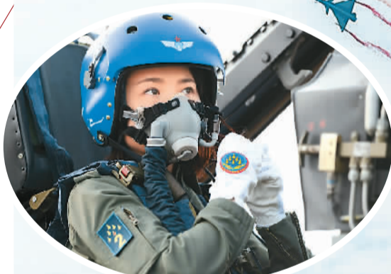
中国空军八一飞行表演队的女飞行员余旭准备驾机表演。