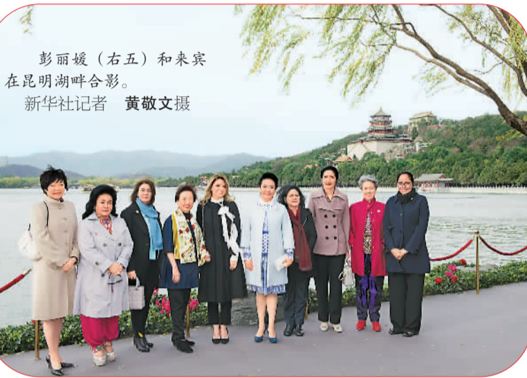
彭丽媛(右五)和来宾在昆明湖畔合影。

彭丽媛和来宾们漫步走过画廊,来到排云殿前合影,共祝亚太经合组织各经济体人民友谊长存。