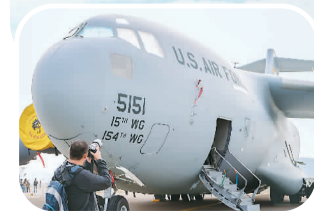
美C-17环球霸王运输机亮相。该运输机是美军现役最先进的大型战略运输机,最大运输距离可达8000公里。