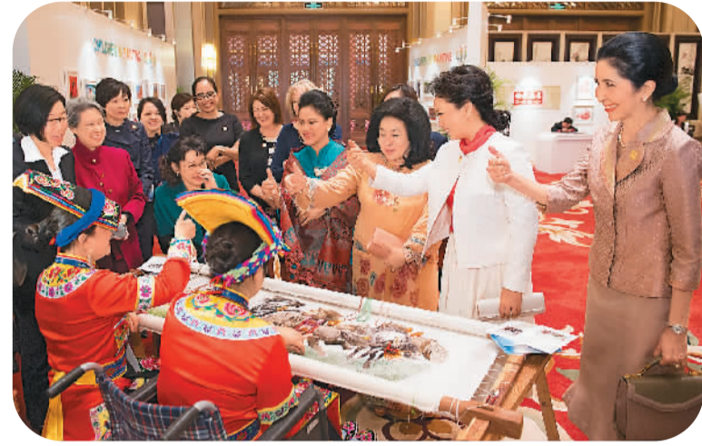
▲彭丽媛(右二)主动用手语问候羌族聋哑姑娘胡蓉,并向来宾示范用手语交流。

本报北京11月10日电(记者赵明昊)10日,国家主席习近平夫人彭丽媛同参加2014年亚太经合组织领导人非正式会议的部分经济体领导人夫人出席由中国残疾人联合会主办的“促进残疾人共享经济社会发展成果”主题系列活动。