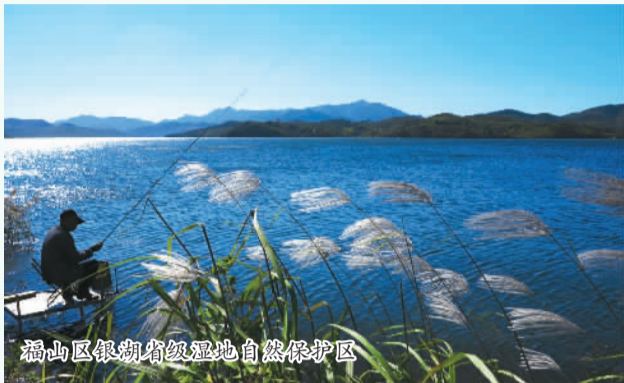
福山区银湖省级湿地自然保护区

福山区的大手笔是源于区委、区政府对人才问题的深刻认识。福山区委书记姜中二说：“人才，作为一个国家和地区的核心竞争力，具有不可替代的作用。引进人才丝毫不亚于招商引资。与一些大城市相比，福山在人才引进上不具备先天优势，而人才的匮乏，必将成为制约发展的‘绊脚石’。”