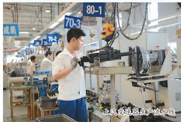
世锐变速器生产流水线

发展实体经济需要实用技能人才。福山区积极出台政策，鼓励扶持企业职工参加各级各类培训，提升专业技能。自2002年起，每年拿出专项