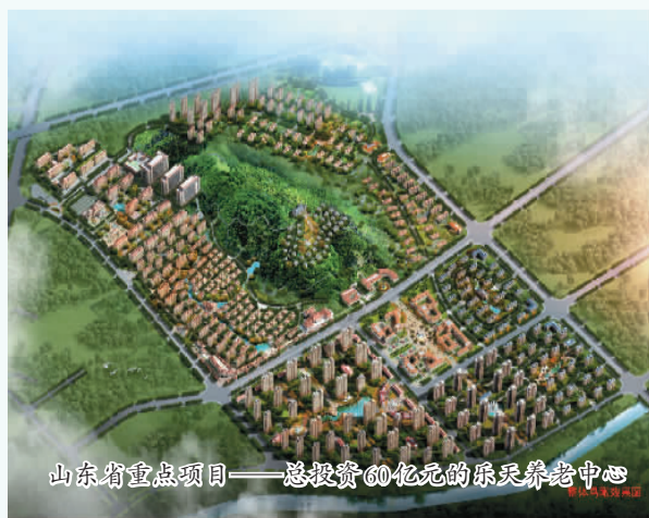
山东省重点项目——总投资60亿元的康天养老中心