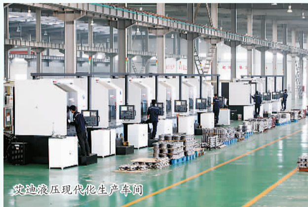
艾迪液压现代化生产车间

引进了一名高端人才，崛起一个战略新兴产业；组建一批创新团队，催生一批高科技企业；集聚一批高层次人才，拉动全区经济社会发展。人才对福山区跨越发展的引领作用逐渐凸显，为产业转型升级注入了无限生机与活力。今年前10个月，福山区财政收入同比增长14.2%，税收收入占地方财政收入比重达到80.8%，实际使用外资增长23.8%。