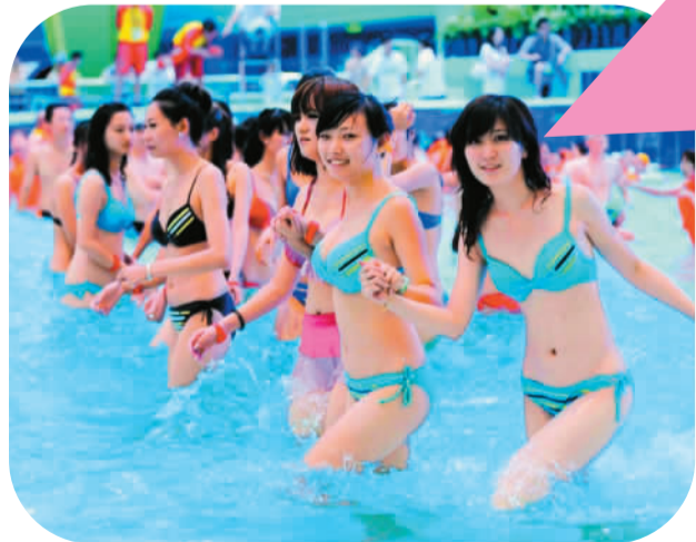
本版图片均为资料图片 水立方戏水乐园一景