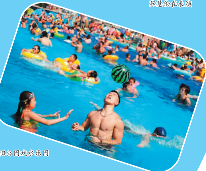
朝阳公园戏水乐园