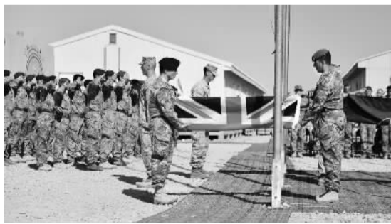
图为美英最后一支部队撤离阿富汗。

在英美撤军、新政府上台的关键时期，阿富汗面临着很多让人头疼的问题，而政府似乎也难以扭