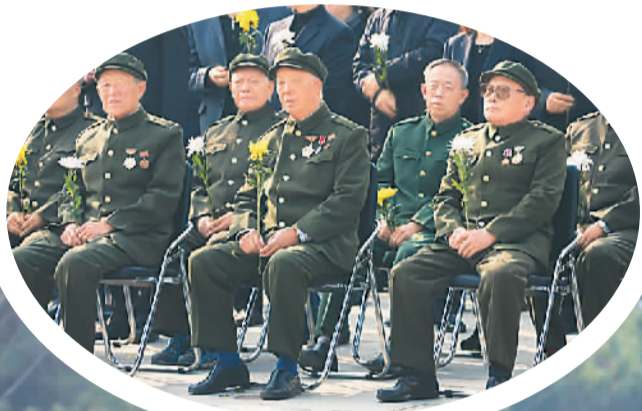
▶志愿军老战士在安葬仪式现场怀念战友。

常委会议闭幕后,俞正声主持政协十二届常委会第六次学习讲座。国家海洋局海洋发展战略研究所所长、研究员高之国应邀作了《南海问题的历史和现状》的报告。