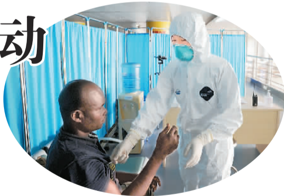
▲在广州白云国际机场,一名旅客(左)在测体温。