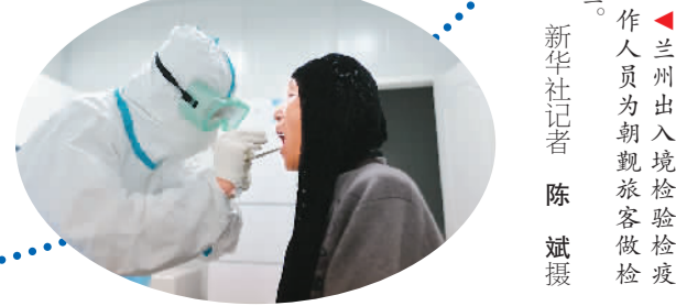
▲兰州出入境检验检疫局工作人员为朝觐旅客做检查。