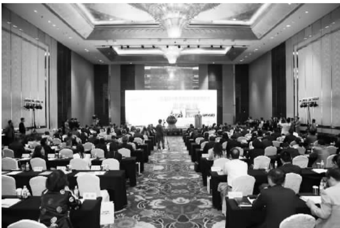
新加坡—青岛城市发展全域合作启动仪式现场

10月26日—27日，中共中央政治局常委、国务院副总理张高丽和新加坡副总理张志贤共同主持中新三个高层合作机制会议。