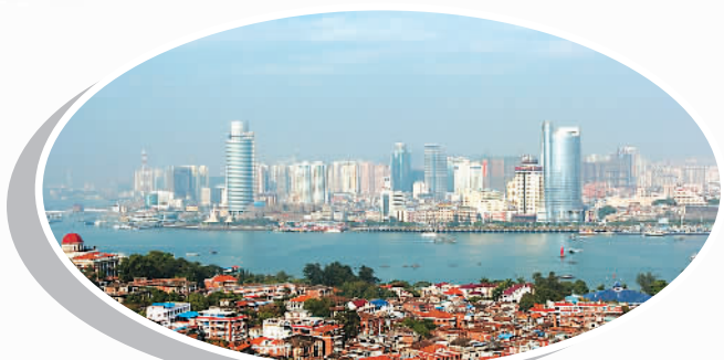
▲ 鸟瞰福建厦门经济特区 (资料照片)

实践证明，经济特区不仅使这些地区的经济得到快速发展，而且在推进对外开放，引进外资、先进技术及管理经验，建立社会主义市场经济体制方面，发挥了窗口作用、试验作用和排头兵作用。