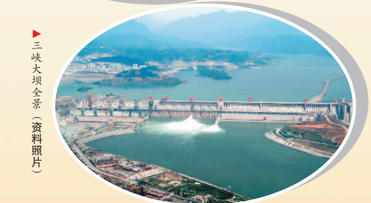
▲ 三峡大坝全景 (资料照片)