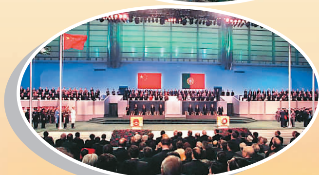
▲ 中葡澳门政权交接仪式现场