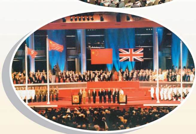
▲ 中英香港政权交接仪式现场