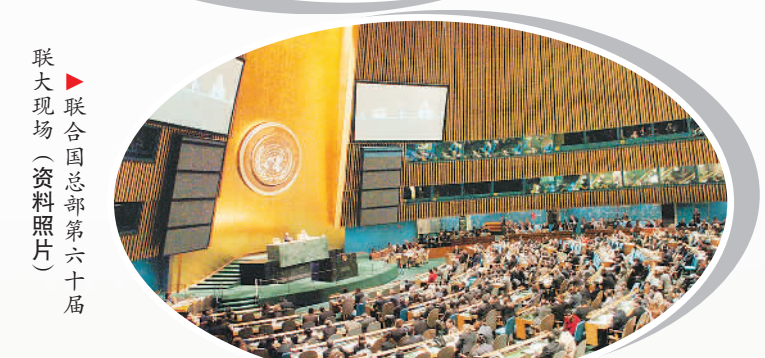
▲ 联合国总部第六十届联大现场 (资料照片)