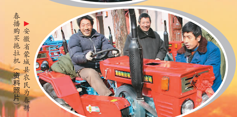
▲ 安徽省蒙城县农民为春耕春播购买拖拉机 (资料照片)