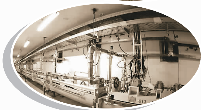
▲ 正负电子对撞机的电子束流输运线 (资料照片)