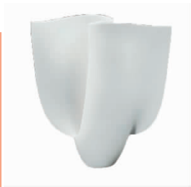
风之静象(陶艺) 金贞华