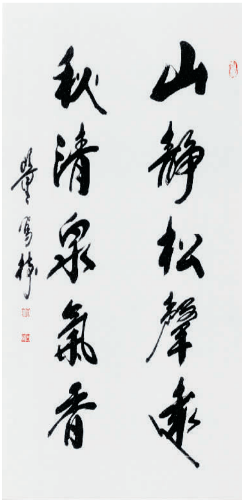
山静松声远 秋清泉气香 董凤树书