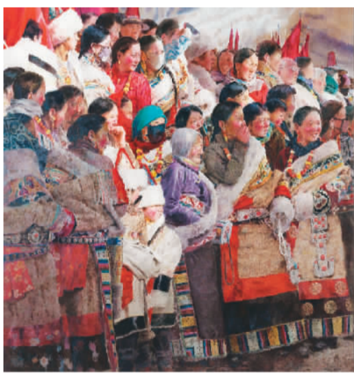
亮宝节上的人们(水彩、粉画) 许海刚

纵观此次全国美展，各艺术门类在发展中呈现出多元化的趋势，体现出时代的风貌，既注重艺术的传承和探索，也关注大众生活的表达，传递出新的艺术气息。