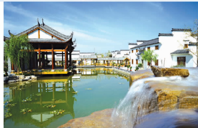
△黄河三角洲文化产业园莲华书院

渤海之滨，黄河之洲，崛起一座魅力无穷、活力无限的现代生态新城——山东省滨州经济技术开发区。经过13年的跨越发展，全区规模以上工业产品销售收入增长了50倍，企业注册数增长了60倍，地方财政收入增长了120倍，财政总收入增长了130倍。先后荣获全省对外开放先进园区、全省重点服务业园区、山东省新型工业化产业示范基地、山东省最具投资价值十佳开发区等荣誉称号。