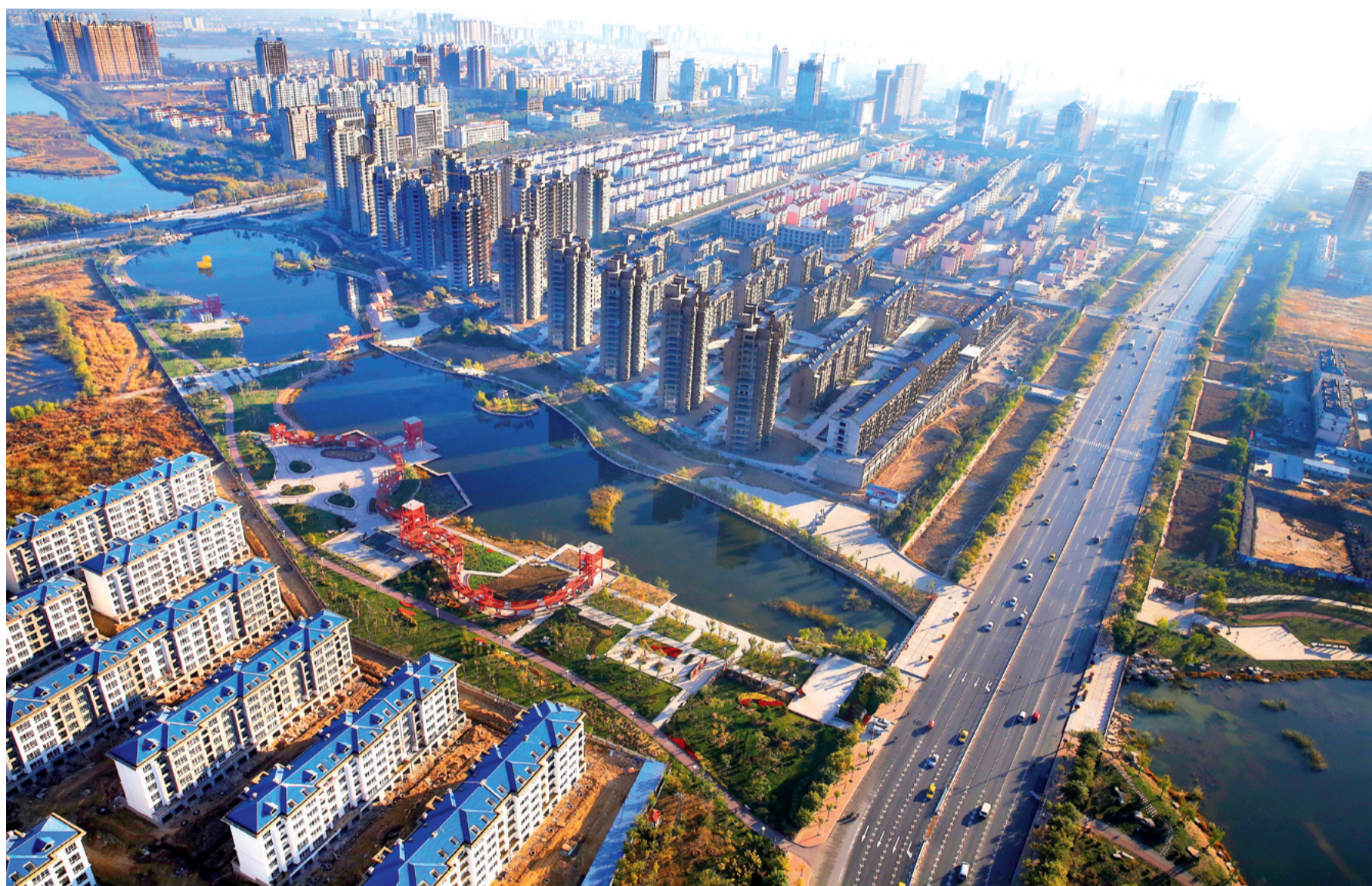
△空中看滨州经济技术开发区

滨州经济技术开发区热忱欢迎社会各界人士前来考察指导、观光旅游、举办活动、投资开发，通过真诚合作共同建设美好的未来！