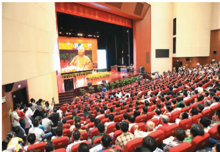
△星云大师在明珠剧院主讲《看见梦想的力量》