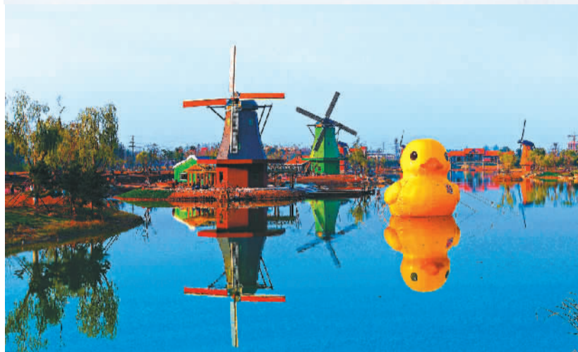
△秦皇河公园荷兰风情村