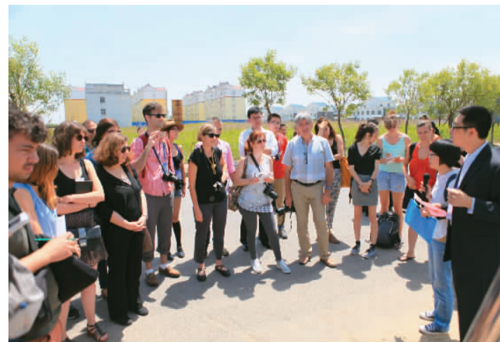
△“欧洲小镇”联合设计活动