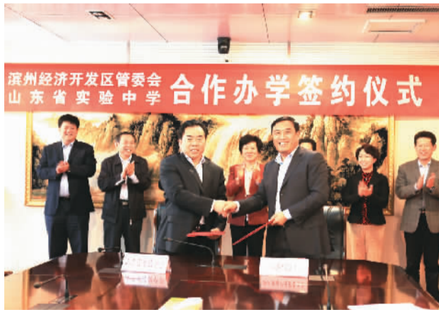
△与山东省实验中学合作办学