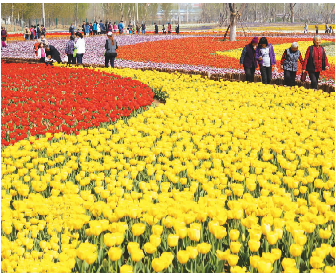
△秦皇河公园郁金香节