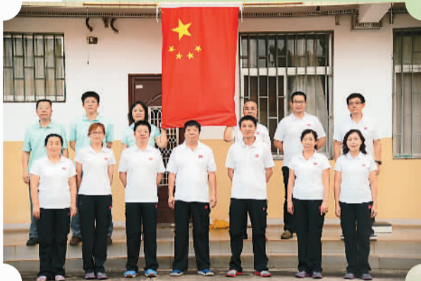
北京友谊医院援几内亚医疗队在当地合影

时间内向公众发布。他提醒说，除了国家卫计委及国家疾控部门等官方发布外，其他说法均为谣言。