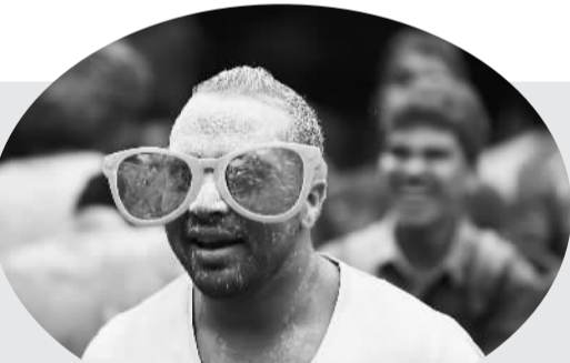
10月16日,一场别开生面的“彩色跑”活动在埃及首都开罗尼罗河畔举行,数百名埃及青年在彩色粉末中尽情狂欢。左图为一名女青年在“彩色跑”活动中抛撒彩色粉末。右图为一名男青年在“彩色跑”活动中奔跑。

命,由此确立了日本民众所自豪的和平主义与民族主义,而现在安倍所奉行的是国家主义行为。”中国社会科学院日本研究所外交研究室主任吕耀东分析道。