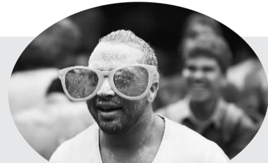
10月16日,一场别开生面的“彩色跑”活动在埃及首都开罗尼罗河畔举行,数百名埃及青年在彩色粉末中尽情狂欢。左图为一名女青年在“彩色跑”活动中抛撒彩色粉末。右图为一名男青年在“彩色跑”活动中奔跑。

据日本《每日新闻》日前报道,针对日本《特定秘密保护法》,该国范围内至少有195个县议会、市町村议会通过了要求日本政府废止或是要求谨慎应用此项法律的意见书。