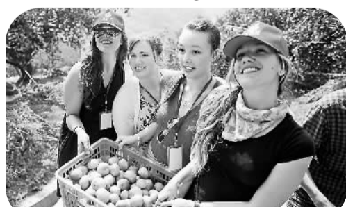
宜昌:夷陵橘香溢神州

本次发行由中银国际担任财务顾问及全球协调人,由中银国际、法国巴黎银行、招商证券(香港)等担任联席簿记管理人及牵头经办人。