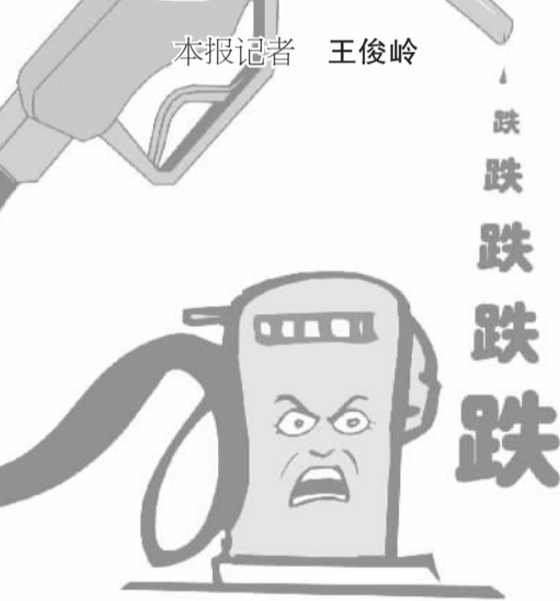
王华斌作(人民图片)

“黑色黄金”的价格缘何“连下楼梯”呢?专家认为,世界经济复苏缓慢、美国原油产量大增