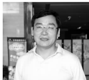
安徽安庆人，厦门大学化学化工学院教授。2010年12月，从日本回国工作。2011年8月，入选“千人计划”。