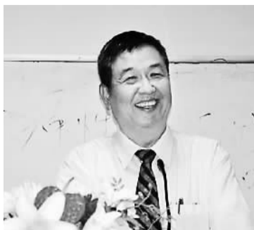
台湾屏东人，厦门大学法学院教授、南海研究院院长。2012年，入选“千人计划”。