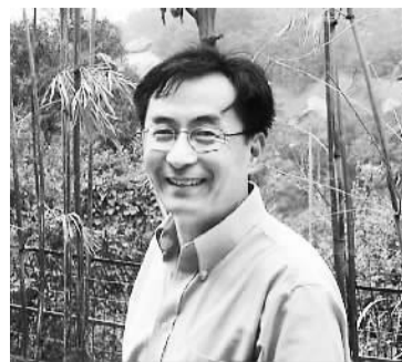
安徽淮南人，厦门大学生命科学学院教授。2007年8月，从美国回国工作。2012年，入选“第七批千人计划（溯及以往项目）”。2013年12月增选为中科院院士。