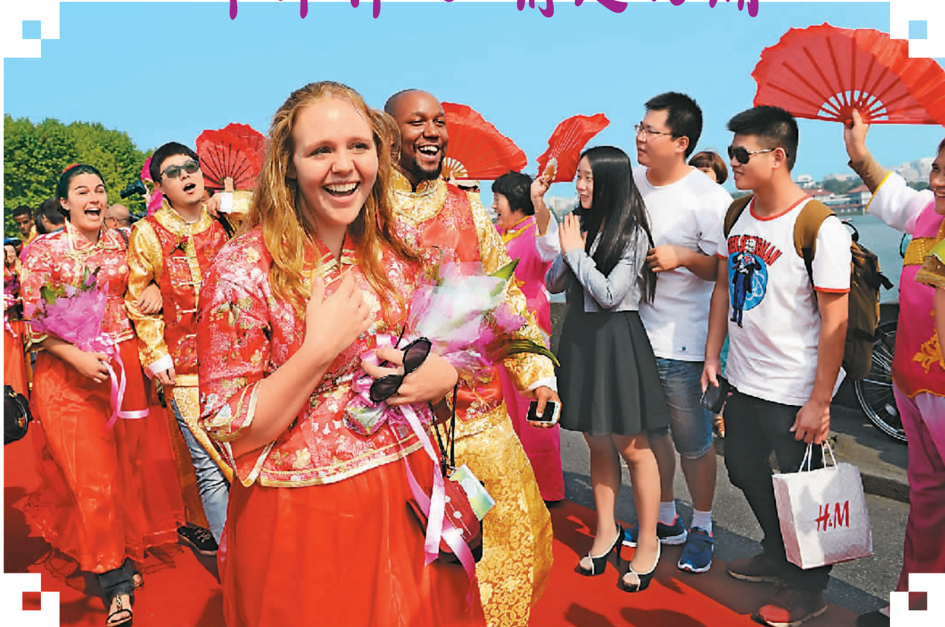
中国及来自美国、法国等十九个国家的一百对新人六日在浙江省杭州西湖举办的中国国际西湖玫瑰婚庆典上喜结连理。图为新人走在红地毯铺成的“玫瑰大道”上。