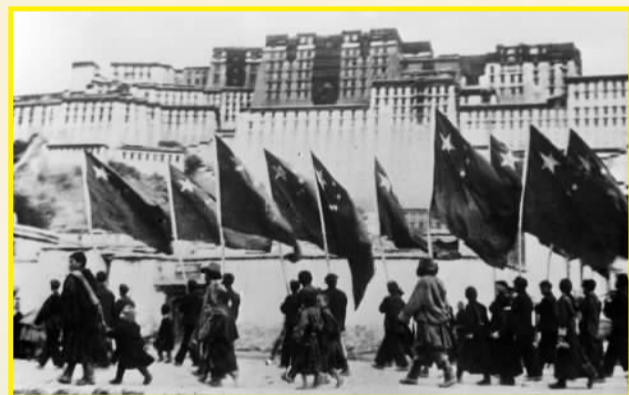
1951年10月26日，西藏地方政府为人民解放军举行了隆重的入城式，拉萨古城飘扬着五星红旗。

西藏的和平解放，粉碎了帝国主义及西藏上层少数分裂分子策划“西藏独立”的迷梦，使西藏摆脱了帝国主义侵略势力的羁绊，捍卫了国家的主权和领土完整，为逐步废除西藏封建农奴制度，实现藏族的新生奠定了基础。西藏的和平解放，是西藏从黑暗走向光明，从分离走向团结，从落后走向进步的重要转折点，西藏从此进入崭新的历史发展时期。这是中国共产党民族政策的重大胜利。