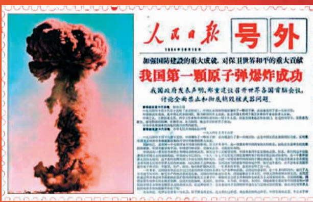
人民日报号外报道我国第一颗原子弹爆炸成功消息。