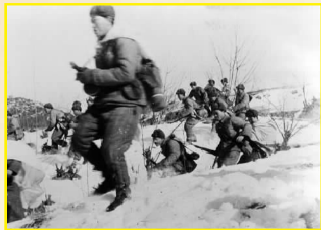
中国人民志愿军战士向美军进攻的情形（1951年摄）。

抗美援朝战争的胜利，打破了美帝国主义不可战胜的神话，极大地提高了中国共产党在全国人民心目中的威信，提高了中国人民的民族自信心和民族自豪感，维护了亚洲和世界和平，使新中国的国际威望空前提高，为国家经济建设和社会改革获得了一个相对稳定的和平环境。