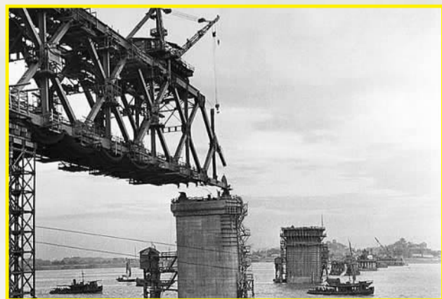
1956年8月18日，武汉长江大桥工程架设一号桥墩。

建一批规模巨大、技术先进的新兴工业部门，同时要用现代先进技术扩大和改造原有的工业部门；要合理利用和改建东北、上海和其他沿海地区城市已有的工业基础，同时要开始在内地建设一批新的工业基地。第一个五年计划的制定，既借鉴了苏联的建设经验，又结合了中国的实际情况。经过全党和全国人民五年的艰苦奋斗，到1957年底，第一个五年计划的各项指标大幅度地超额完成，形成中国近代以来引进规模最大、效果最好、作用最大的工业化浪潮。我国的工业生产能力和技术水平前进了一大步，取得了令人瞩目的成就，为后来的工业化奠定了基础，特别是人力资源和技术资源的基础。