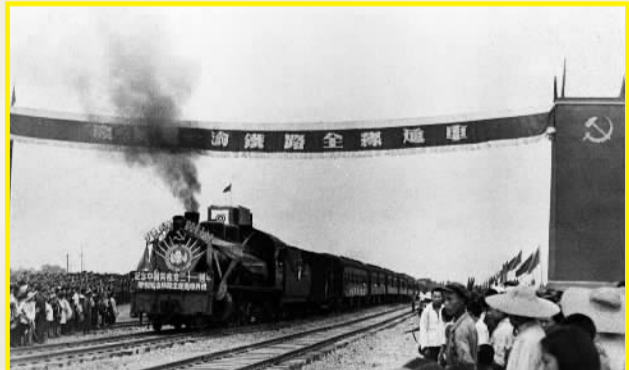
1952年7月1日，成渝铁路全线通车。图为由成都驶往重庆的第一列火车出站。

1952年7月，成渝铁路建成通车。该路全长505公里，完全由中国自行设计施工，采用国产材料修建。这条铁路是清朝末年就酝酿兴建的川汉铁路的一段，拖了近半个世纪没有铺上一根钢轨，而新中国成立后仅用两年时间就建成通车。成渝铁路的建成，推动了西南地区经济的恢复和发展。毛泽东为成渝铁路建成通车题词“庆祝成渝铁路通车，继续努力修筑天成路”。邓小平的题词是：“庆祝成渝铁路全线通车”。