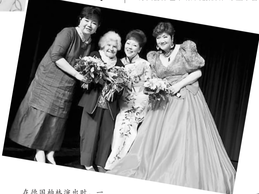
在德国柏林演出时，一位104岁的德国老太太（左二）专程驱车400多公里前来观看，和演员一起合影留念。