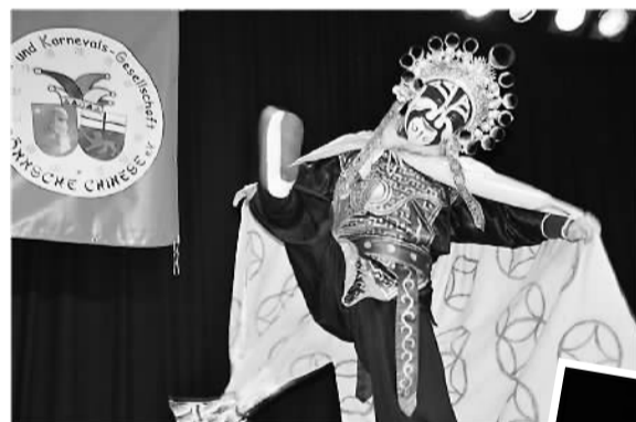
演员表演神奇莫测的川剧变脸。

本报电（鹏鹏）日前，应波兰华人联合会和中国驻德国大使馆邀请，北京市侨联“北京情思”艺术团一行13人前往波兰、德国为当地华侨华人进行慰问演出。在7天时间里，艺术团分别在波兰华沙、德国柏林、波恩、慕尼黑等4个城市举行4场演出，约有3000名当地华侨华人和外国人士观看，为海外华侨华人奉献了丰富的文化大餐。