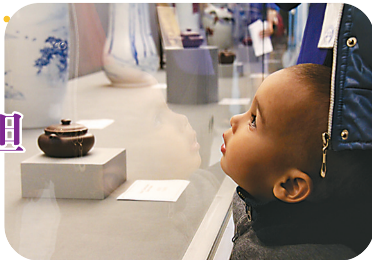
在“瓷韵中华”中国陶瓷紫砂艺术展上,哈萨克斯坦小朋友对中国瓷器充满好奇。

哈萨克斯坦文化体育部部长穆哈梅季乌雷激动地说:“展品水平很高,哈萨克斯坦民众很感兴趣!”他对记者说,哈中两国