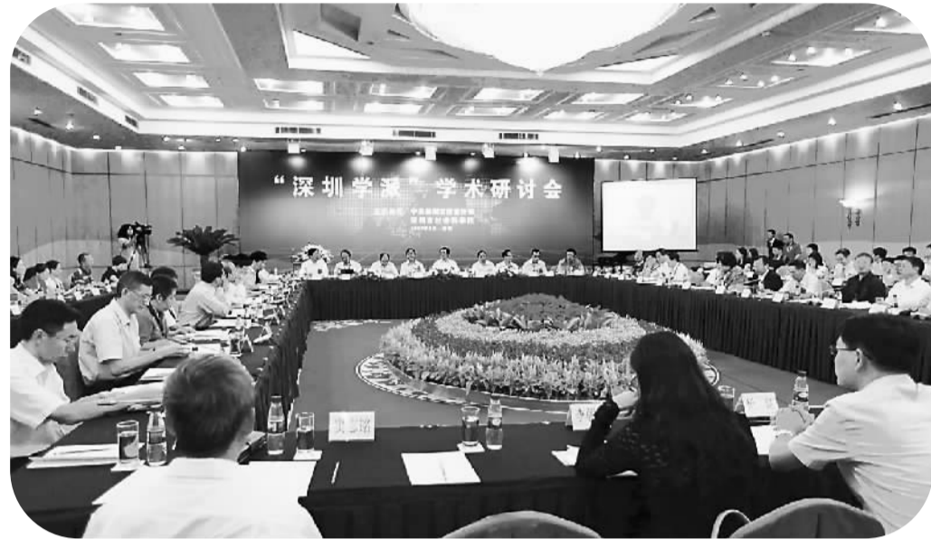
「深圳学派」学术研讨会

创新发展提供宝贵借鉴。自2012年5月王京生《文化是流动的》一文发表以来，特别是2013年10月《文化是流动的》一书由人民出版社出版之后，“文化是流动的”这一命题就成为深圳，甚至全国文化理论界讨论的热点问题，一大批知名学者参与其中。在特区成立之初，深圳被戏称为“文化沙漠”，但在改革开放进程中，深圳的观念文化、移民文化、企业文化等却一路领先并辐射全国，近年来城市文化更是跨越发展。“文化是流动的”正是深圳作为新兴城市在文化创新中实现文化发展“弯道超车”的理论依据，而深圳，也正是文化流动理论最为生动的样本。