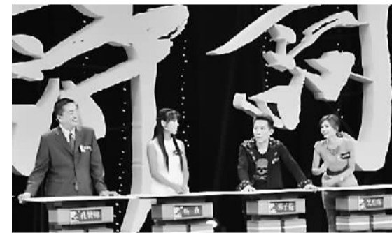
在台湾拥有众多观众的河北电视台《中华好诗词》制作团队，近日在台北录制两期《中华好诗词》——走进台湾特别节目，来自海峡两岸的诗词好手混合编队，在比拼中展示才华。图为录制现场。

连续5届的汉字艺术节，让两岸艺术家沟通了感情，增进了了解，更重要的是，双方在平等互信的基础上，开启了不同方向和层面的文化合作：中国艺术研究院依托汉字艺术节，在山东台儿庄建立了大陆首个两岸汉字艺术馆，将两岸艺术家的创作精品永久陈列、收藏；中华文化总会与中国艺术研究院合作出版了《台北道地，地道北京——两岸生活小词典》；汉字节还推出了两岸文化界共同建设的动态数据库——“中华语文知识库”，并向全球华人免费开放，成为中华文化面向世界的一个窗口。