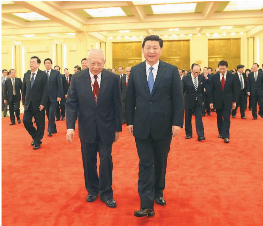
九月二十二日, 习近平在人民大会堂会见以董建华为团长的香港工商界专业界访京团。