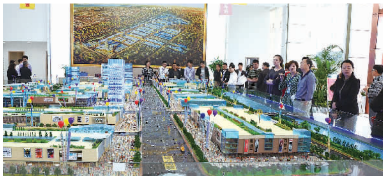
湖南长沙已竣工的香江集团高岭国际商贸城的沙盘前，来自全国各地的客商踊跃订购。

为推动高岭商贸组团的建设和发展，加快实现长沙现代商贸物流产业转型升级，政府投放了千亿配套做支撑。除了原有的“四纵”“四横”交通路网之外，还规划有专用快速客流通道——高岭交通枢纽客运港、车站北路延长线与捞刀河无缝对接，建设中的长株潭城际轻轨及地铁1号线、规划中的地铁10号线，与高岭国际商贸城全面接轨，保障客流畅通；同时建设专用快速货运通道——铁路、货运北站铁路港、霞凝水路港，和以传化物流为代表的公路港将形成完善的交通体系保障货运通达。金霞开发区拥有湖南省唯一的保税物流园区，为高岭国际商贸城进口商品交易区提供巨大保障。周边城市商业综合体、金融服务、酒店、购物中心、学校、医院、高端住宅和5A级湿地公园等全方位配套一应俱全。