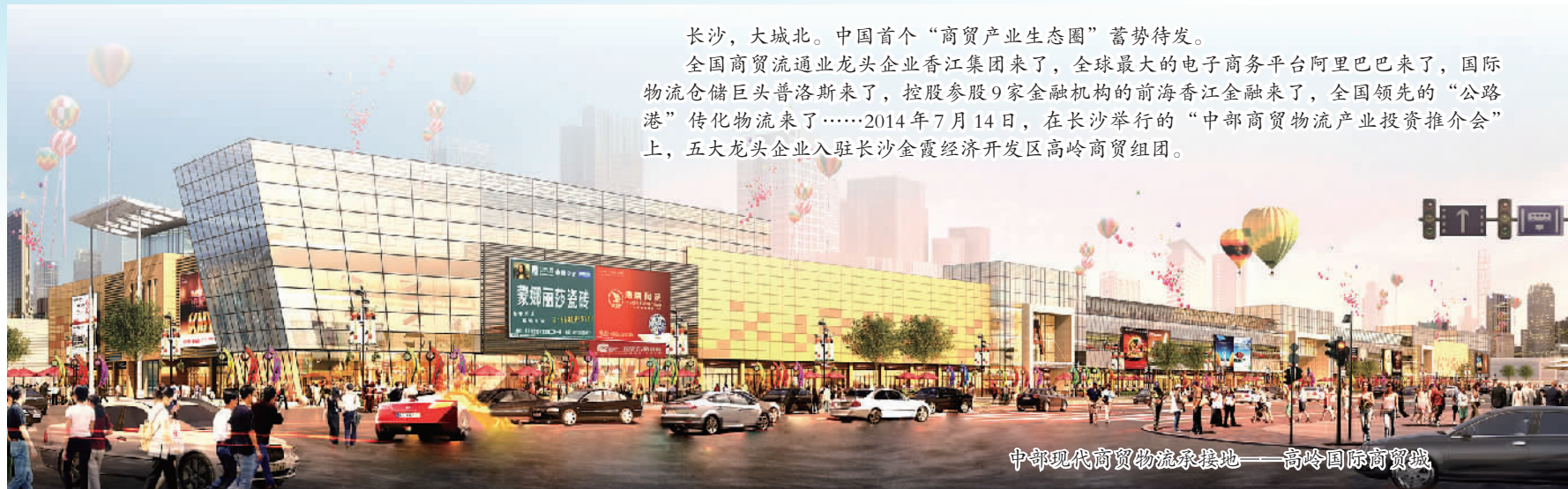
中部现代商贸物流承接地——高岭国际商贸城

长沙，大城北。中国首个“商贸产业生态圈”蓄势待发。 全国商贸流通业龙头企业香江集团来了，全球最大的电子商务平台阿里巴巴来了，国际物流仓储巨头普洛斯来了，控股参股9家金融机构的前海香江金融来了，全国领先的“公路港”传化物流来了……2014年7月14日，在长沙举行的“中部商贸物流产业投资推介会”上，五大龙头企业入驻长沙金霞经济开发区高岭商贸组团。