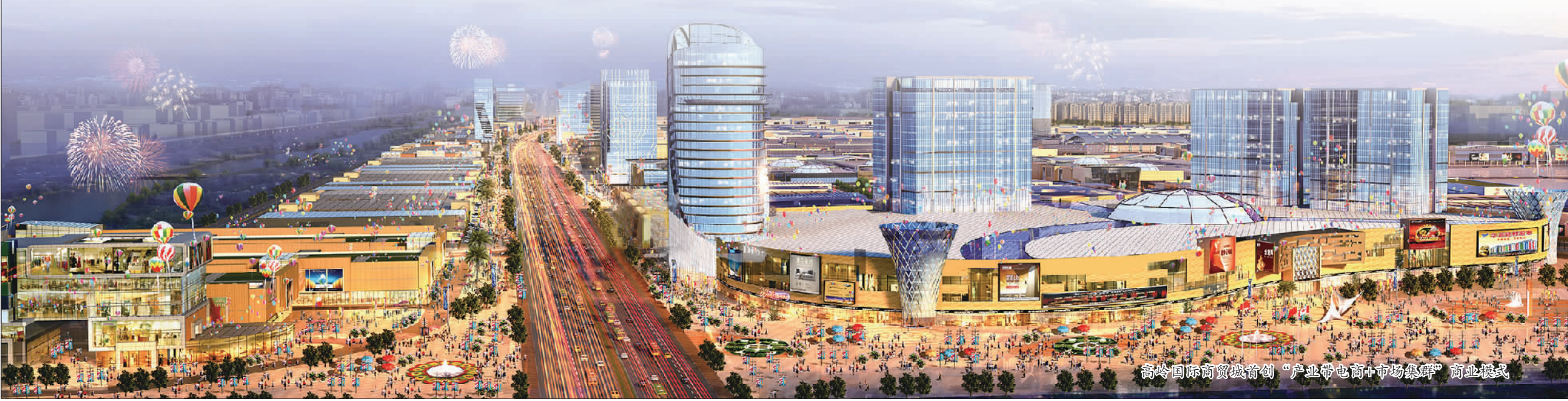
高岭国际商贸城首创“产业带电商+市场集群”商业模式