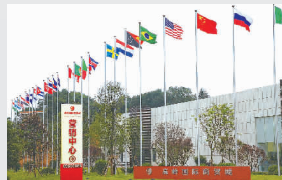
建成的香江集团湖南长沙高岭国际商贸城营销中心外景。

高岭国际商贸城首创“产业带电商+市场集群”商业模式，助买家直达原产地优质货源，助卖家有效提升竞争力，构建线上线下体验聚合平台，集商品展示、交易、设计、创意研发、物流配送、信息服务、电子商务、会展等功能于一体，汇集全球商品流、人才流、资金流、信息流，运用数据信息及电商平台，成为立足长沙，辐射湖南、湖北、江西、贵州、广西、重庆等省市，影响中西部三亿多消费人群的全球商品交易集散中心和全球电商总部集聚平台，届时可为社会提供35万个就业岗位，年交易量将过千亿元。