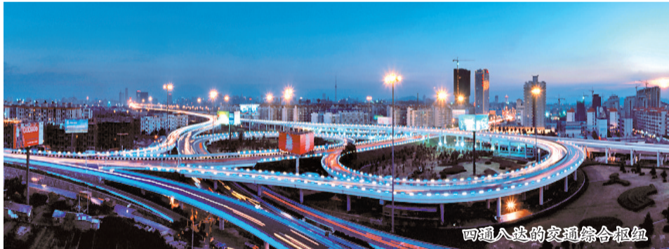
四通八达的交通综合枢纽

霞段）建设和银行、市场、娱乐、文化等生活服务设施布点，提升城市品质，增强要素吸纳能力。破解发展瓶颈。深化市国土储备中心、园区、项目单位“三位一体”的土地储备模式，加大征拆力度，力争年内储备土地3000亩。加快土地挂牌和已挂牌土地资金回笼，盘活土地上的沉淀资金。抢抓政策机遇，抓好城镇化建设贷款和中行保税政策贷款的申报工作，力争新增银行贷款10亿元，强化开发建设资金保障。