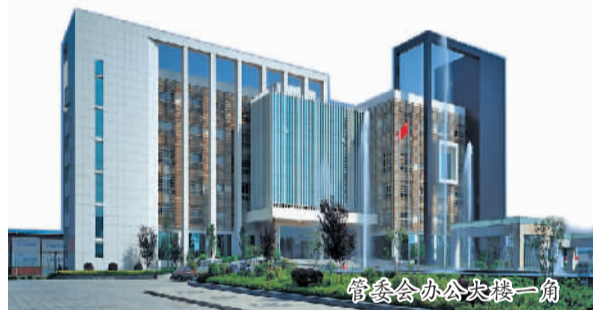
管委会办公大楼一角

扩建物流平台。加快新港三期建设，新增6个2000吨级泊位，建好货物堆场、港区铁路专线、消防码头，推动港区扩容提质；加快铁路货运新北站二期手续办理，力争年内启动建设，完善集装箱、特货、快运、冷藏、仓库和口岸功能等作业区功能；支持湘粮集团完成霞凝粮库3个2000吨级粮食码头建设，引进普洛斯物流、传化物流，借助市场力量完善物流仓储，打造金霞公路港。提质保税平台。按省、市安排，在保税物流中心的基础上，完成物流大厦、跨境贸易监管、保税仓库改造及保税中心二期建设，建好长沙电子口岸信息平台、长沙跨境贸易电子商务公共服务平台、湖南进出口商品展示交易中心，加快推进湖南电子商务产业园建设，提升综合保税功能。整合平台资源。重点优化“五定班列”和“五定班列”，拓展水铁、公铁多式联运、陆路口岸运输和快递业务，促进水运、铁路、公路“三港互动”。建立和完善金霞联检机制，整合海关、商检职能，增加外汇、国税、工商、银行、保险等机构进驻，引入“属地申报，口岸验放”的快捷通关模式，真正实现“一次报关、一次报检、一次放行”。