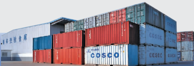
长沙新港——全国20个内河枢纽港之一

队伍综合素质，打造一流的创业团队。加快创新型园区建设，健全机制，鼓励创新，激活创造，推动园区提质增效，转型发展。弘扬企业文化。发挥企业文化的引导作用，引导干部职工将园区事业和荣誉视为自己的人生追求，将“顺势永进，创造成功”的金霞精神内化为干部职工的理念自觉，外化为干事创业的激情和斗志，共同推动园区后发赶超、富国强盛。