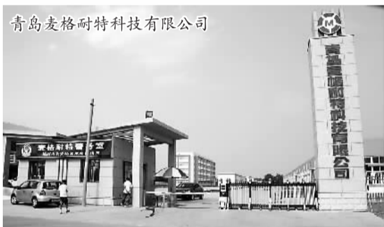
青岛麦格耐特科技有限公司

1992年，在“一位老人在中国的南海边写下诗篇”之后不久，莱西经济开发区就诞生了。截至目前，莱西经济开发区落户内外资企业2300多家，其中规模以上企业350家。有美国、日本、韩国、德国、瑞士、意大利、加拿大、罗马尼亚、香港、台湾等国家和地区投资的项目275个。其中包括投资150亿元的迪趣文化城、74亿元的青岛伊科思合成橡胶新材料产业基地、12亿元的青岛麦格耐特科技有限公司、8.7亿元的青岛雀巢有限公司、7.9亿元的青岛海升果业有限公司、5.35亿美元的青岛耐克森轮胎有限公司、6000万美元的青岛泰光制鞋有限公司、4500万美元的希杰（青岛）食品有限公司、3000万美元的阿菲尼亚（青岛）制动系统有限公司以及国