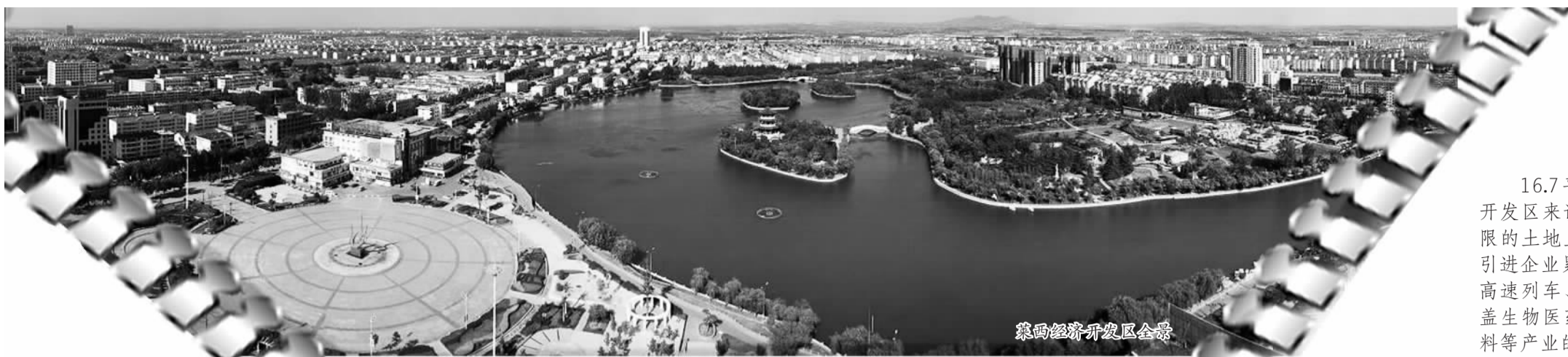
莱西经济开发区会景

“给我20年，还你个强大的俄罗斯！”俄罗斯总统普京的这句名言，被无数次地套用。在距莫斯科近万公里的黄海之滨，人们同样可以自豪地说：“给我20年时间，还你个强大的莱西经济开发区！”