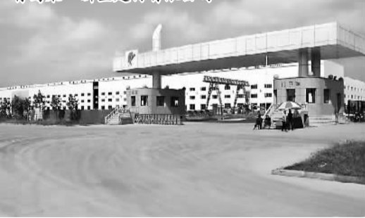
青岛荣一新型建材有限公司

为了让工业组团发展无后顾之忧，莱西经济开发区先后投资110多亿元，配套建设了热电厂、220千伏变电站和110千伏变电站、污水处理厂、自来水厂、静脉产业园、天然气站等大型基础设施。工业园还实现了道路、供水、排水、排污、供电、供热、供气、通讯、数字电视全通，金融、商贸、生活等服务功能日臻完善。数字能形象地说明问题：区内10多所变电站双回路供电不间断；3处水厂日供水能力20万吨；2座热电厂，供热能力每小时500多吨；2条天然气管路，日供气能力80万立方米；2处污水处理厂，日处理污水能力12万吨。