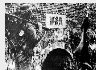
中国军队收复昆仑关。(资料照片)