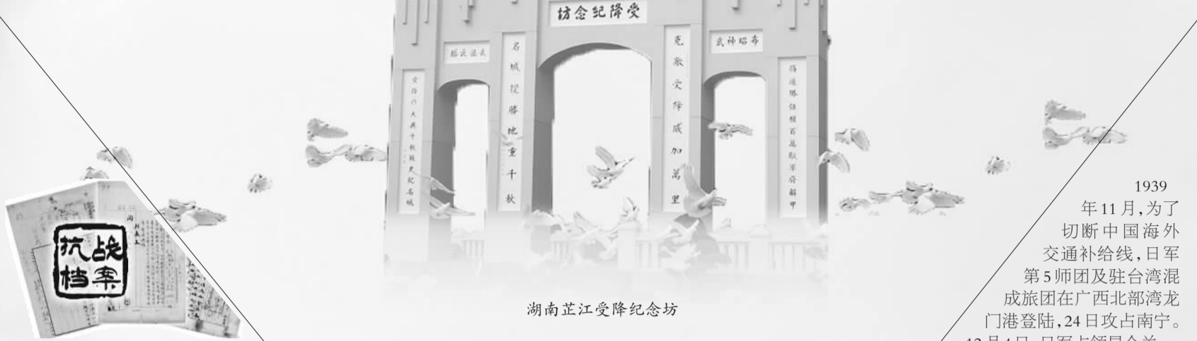
湖南芷江受降纪念馆