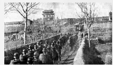
中国军队进入襄阳。