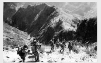
八路军参战部队粉碎了敌人对北岳区的“扫荡”。