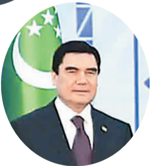
会见哈萨克斯坦总统时指出

本报杜尚别9月12日电 (记者杜尚泽、林雪丹) 国家主席习近平12日在杜尚别会见土库曼斯坦总统别尔德穆哈梅多夫。习近平指出, 过去一年, 我和别尔德穆哈梅多夫总统成功互访, 共同规划了中土关系未来发展, 推动了一系列大项目合作, 中土战略合作伙伴关系实现良好开局, 两国已成为合作共赢的利益共同体和守望相助的命运共同体。双方要继续深化能源合作, 确保中国—中亚天然气管道建设和运营, 做好复兴气田二期产能建设。同时, 双方要优化贸易结构, 逐步扩大电力、制造业、农业等非能源合作, 共同推动丝绸之路经济带建设, 对接两国发展战略, 拉动交通、通信等领域合作。双方要加强油气管道和大型国际活动安保领域合作, 共同打击“三股势力”。