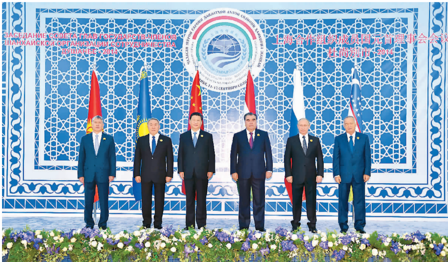
ЗАСЕДАНИЕ СОВЕТА ГЛАВ ГОСУДАРСТВ ЧЛЕНОВ ШАНХАЙСКОЙ ОРГАНИЗАЦИИ СОТРУДНИЧЕСТВА ДУШАНБЕ - 2014