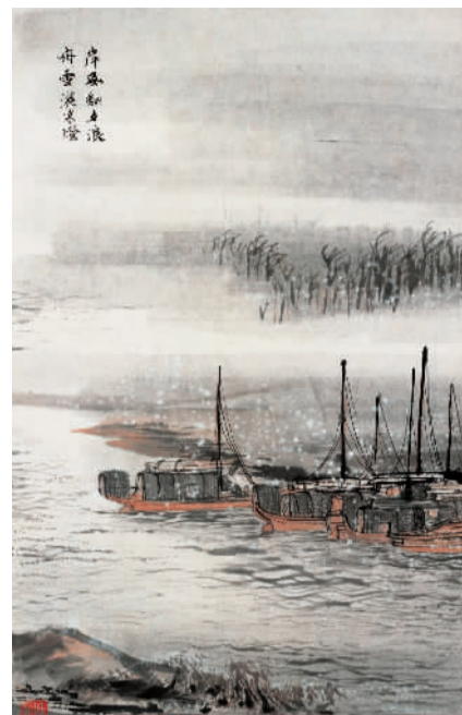
岸风翻夕浪，舟雪洒寒灯 陆俨少

在我看来，中华民族的民族精神可以用易经的天地卦辞来概括，“天行健，君子以自强不息，地势坤，君子以厚德载物”。没有任何一个民族能够在其文明早期明晰地认识到这样的阴阳合一而对立依存永恒周转的关系。在这样的民族精神下派生出的中华民族“大美为真的写意精神”的艺术精神，指引着数千年中国艺术从无到有，从有到无，有无相生而生生不息。这条文脉何等的深邃，这条大河何等的壮阔，使她成为数千年来的人文奇观，而近200年来，她虽被忽视但实际是“有大美而不言”的一种存在。