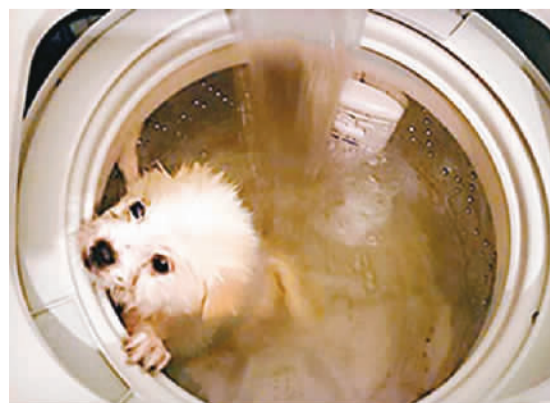
洗衣机洗狗图让香港网友痛心

爱护动物协会表示，由相中所见该部洗衣机在转动，如有人令宠物受到惊吓或伤害均属违法，“养宠物系要爱它”。协会呼吁市民切勿模仿，如有涉案者资料可向警方举报。