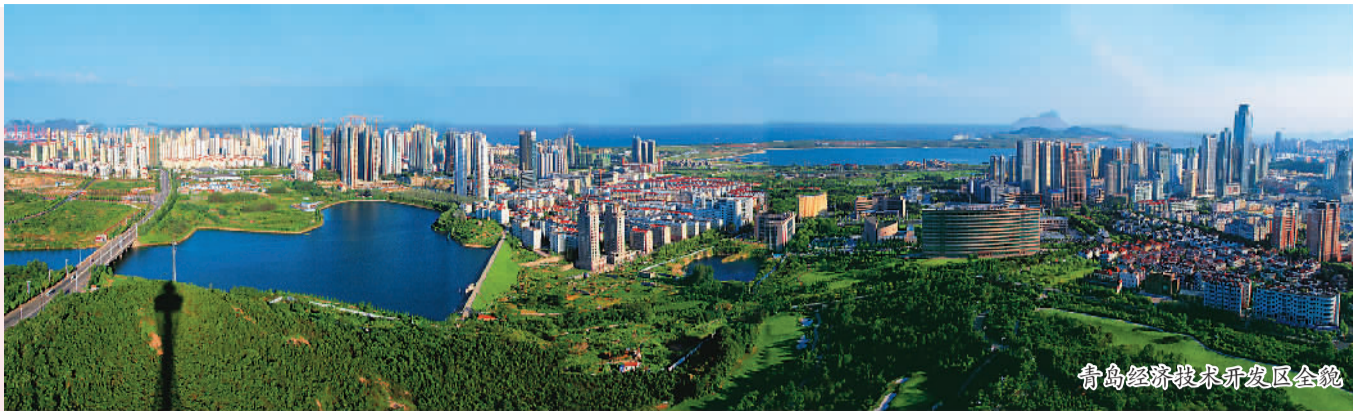
青岛经济技术开发区全景