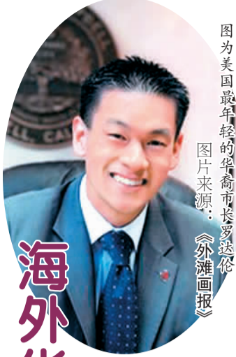
图为美国最年轻的华裔市长罗达伦。