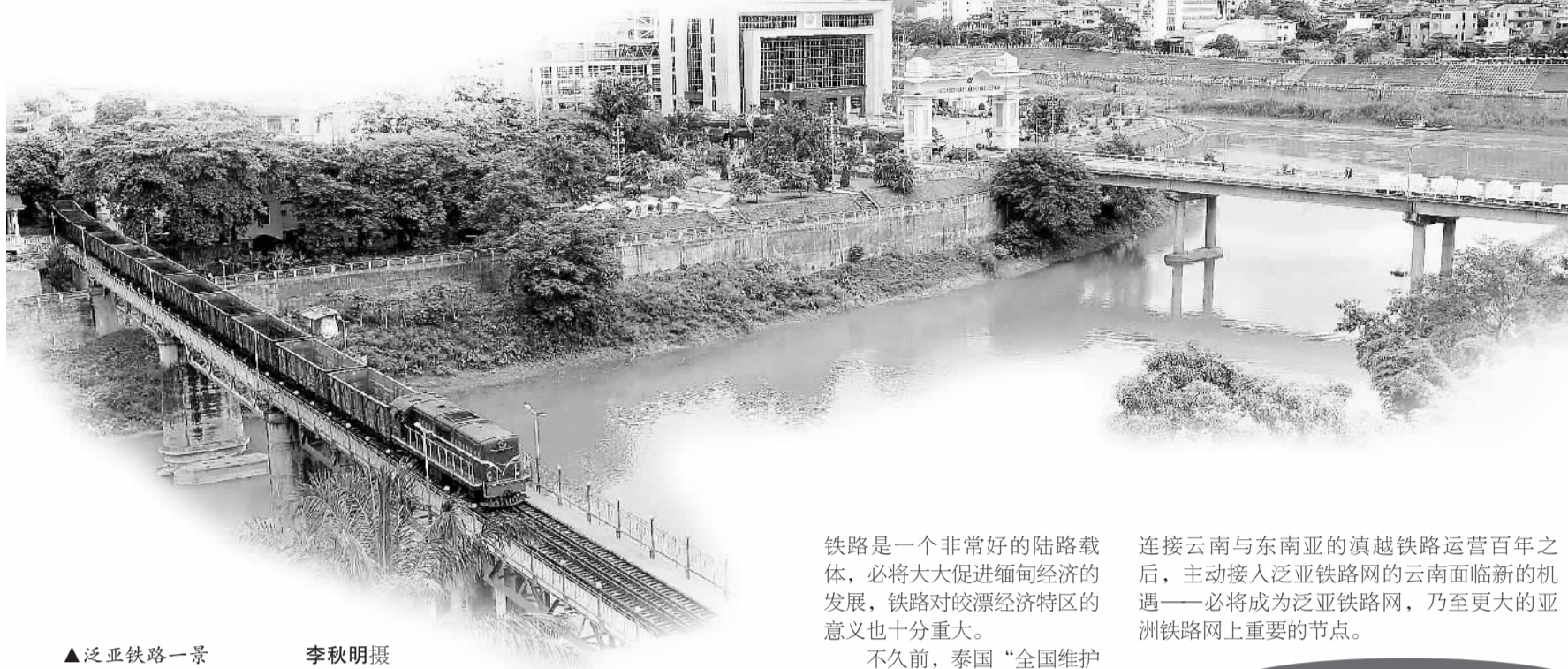
▲泛亚铁路一景

作为中国较早通铁路的省份,一直以来,铁路建设在云南对外开放中扮演着非常重要的角色。百年滇越铁路曾经承载辉煌,泛亚铁路的构想更让铁路从昆明直通新加坡,把云南与东南亚国家紧密联系在一起。